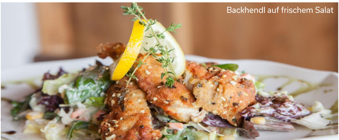
Backhendl auf frischem Salat

Cheeseburger mit Pommes € 19,50 saftig gebratenes Beef, Salat, Speck, Käse, Tomaten, Gurken & Spezialdip » roasted beef, salad, bacon, cheese, tomatoes, pickles, special dip with French fries